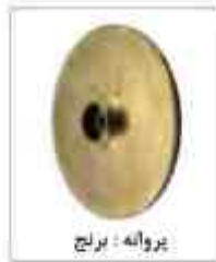
پروانه - برنج