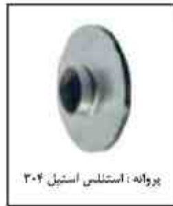
پروانه: استنلس استیل ۳۰۴